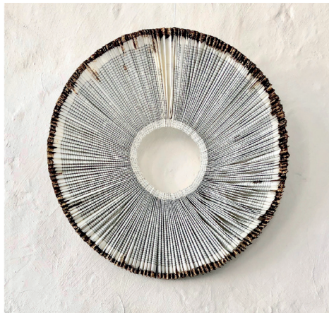
O VENCEDOR ESTA SÓ